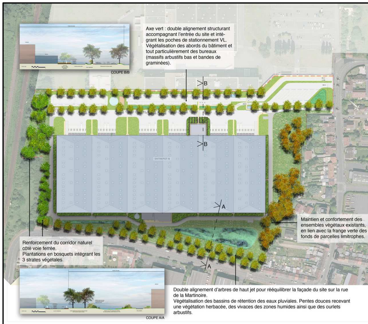
Figure 2 : Plan paysager du site (KALIES, 2018)

Le plan paysager ci-après rend compte de la logique de restitution des corridors recherchée dans le cadre du projet.